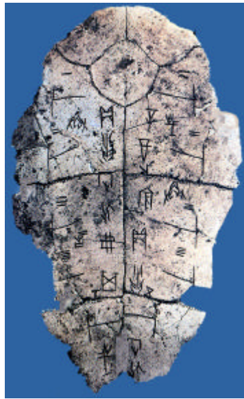
Figure 1. Plastron d'une tortue. Epoque Shang 17 ème avant JC.