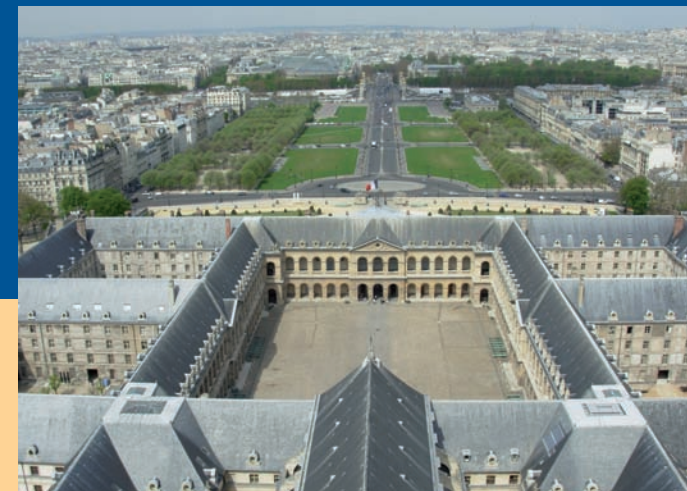
HDI - J.F.P. - © Photos : DR