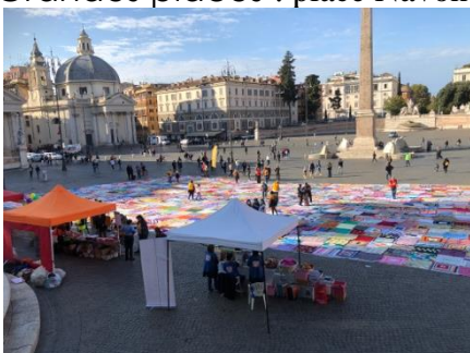
Quartier du Panthéon

Grandes places : place Navone, la Place Saint-Pierre ou la Place d'Espagne