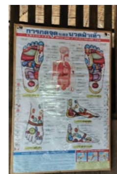
Localisation des points par cartographie locale