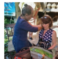
La thérapeute locale en pleine action