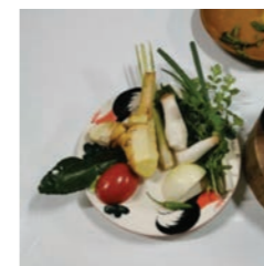
Wok de légumes