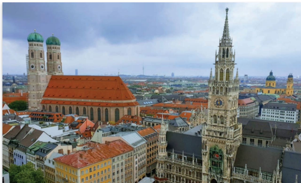
La Cathédrale Notre-Dame de Munich (Frauenkirche) du XV- XVIe vue depuis le clocher de l'église Saint-Pierre et la place Marienplatz (« place Sainte-Marie », place du centre de Munich fondée en 1158.

La LMU Klinikum, où auront lieu les stages, avec ses deux sites munichoïses Campus Großhadern et Campus Innenstadt compte parmi les plus grands hôpitaux universitaires d'Allemagne et d'Europe. Chaque année, environ 500 000 patients font confiance à la compétence,