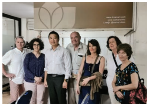
L'équipe des stagiaires