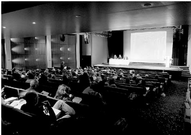
Figure 1. L'amphithéâtre du congrès de l'AFERA.

Devant une nombreuse assistance (190 inscriptions dont 80 sages-femmes), les orateurs ont fait partager leur expérience avec des communications pédagogiques et pratiques qui se sont succédé en un rythme bien dosé permettant un échange dynamique et fructueux (figure 1).