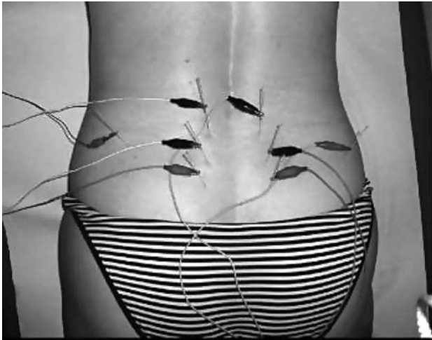
Figure 3. Exemple de traitement en électroacupuncture d'une lombalgie chronique (Document Marcello H. Tegiachchi Schvetz).

dorso-lombaires (dorso-lombalgies, lombalgies, lombosciatalgies : figure 3), pieds (maladie de Morton), démontrant la souplesse et l'adaptabilité de ce mode de traitement.