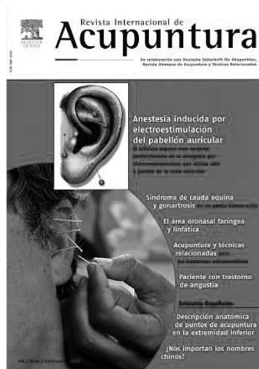
Figure 5. La Revista Internacional de Acupuntura, organe officiel de : Sociedad de Acupuntura Medica de Espana (SAME) ; Seccio d'Acupuntura, Col.legi de Metges de Barcelona ; Asociacion de Medicos Acupuntores. Colegio de Medicos de Madrid ; Seccion Acupuntura. Colegio Oficial de Medico de Zaragoza ; Societat Cientifica d'Acupuntura et Catalunya i Balears ; Seccion Medicos Acupuntores, Homeopatas y Naturistas. Colegio de Medicos de Asturias ; Seccion HAN. Homeopatia, Acupuntura y Naturismo. Colegio de Medicos de Asturias. En collaboration avec : Sociedad Portuguesa Medica de Acupuntura ; Deutsche Ärztesgesellschaft für Akupunktur e.V. (DÄGfA) ; Österreichische Gesellschaft für Akupunktur e.V. (ÖGA) ; Deutsch Gesellschaft für Akupunktur und Neuraltherapie e.V.(DGfAN) ; Österreichische Wissenschaftliche Ärztesgesellschaft für Akupunktur (ÖWÄA) ; Association Luxembourgeoise des Médecins-Acupuncteurs (ALMA).

Nos amis espagnols participent à la publication de la Revista Internacional de Acupuntura , fruit de la collaboration de près d'une dizaine de sociétés médicales d'acupunctures allemandes, autrichienne, espagnoles (catalane, castillane, valencienne), portugaise et luxembourgeoise (figure 5). Le N° avril-juin 2008 (Vol 2, N° 2) porte sur : Anesthésie induite par l'électrostimulation du pavillon de l'oreille ; Syndrome de la queue de cheval et gonarthrose ; Aire oronasale, pharyngienne et lymphatique ; Acupuncture et techniques associées pour le traitement des troubles psychosomatiques ; Patient avec trouble d'angoisse ; Description anatomique des points d'acupuncture de l'extrémité inférieure ; Importance du nom chinois ?