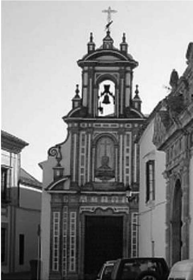
Figure 6. Clocher de l'Hôpital de La Miséricorde et de la Charité (XVI ème siècle).

La ville de Carmona où se déroulait ce symposium est magnifique. Sa fondation remonte à l'époque romaine. Elle fait partie des villages blancs. Couvents, églises et palais sont vieux de plusieurs siècles (figure 6).