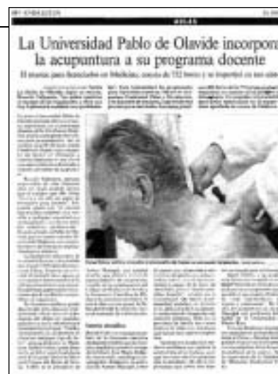
Article paru dans le quotidien national "El país".

Néanmoins, au fil des pages et en suivant le lien "temas de refrescos" (sujet de révisions), on découvrira