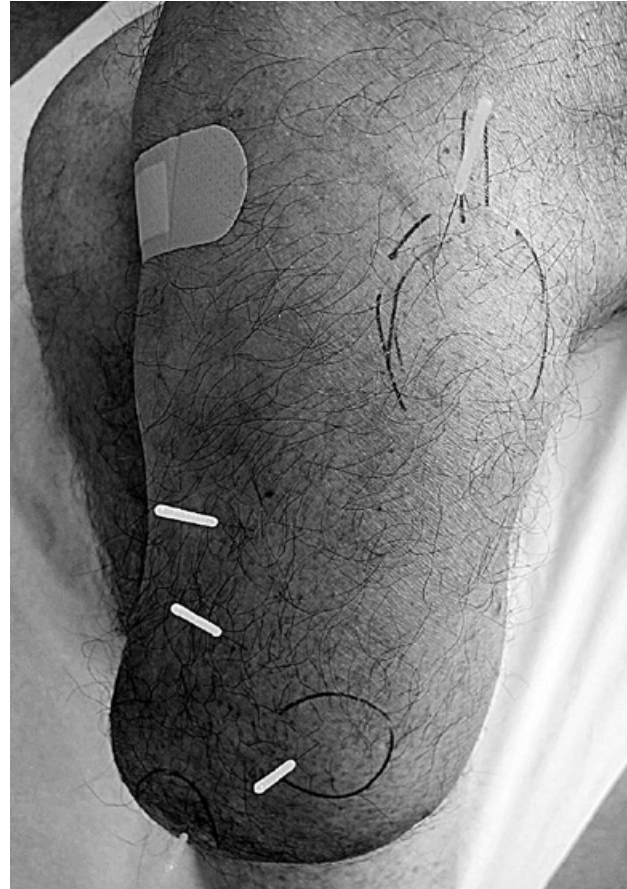
Figure 4. Patient bénéficiant d'une « triple » séance : en haut pour une douleur résiduelle du ligament de l'articulation tibio-péronière supérieure (qui a également bénéficié d'une manipulation), de deux triggers points musculaires le long de l'arête tibiale, et enfin de deux névromes d'amputation douloureux en distal.