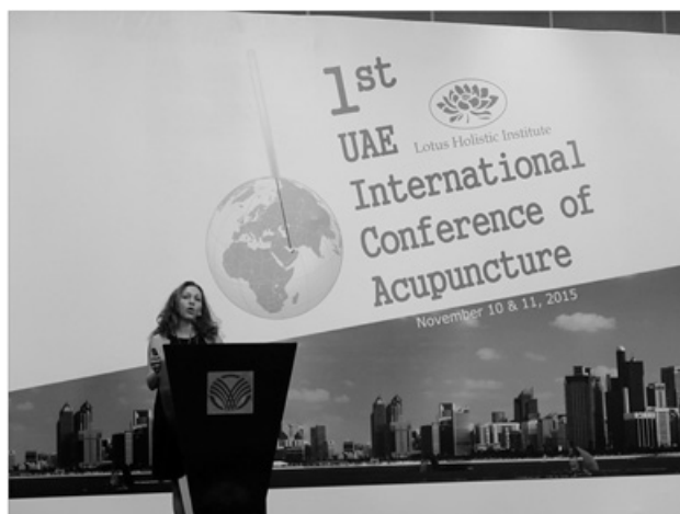
Figure 2. Konstantina Theodoratou, Présidente de l'ICMART.

Konstantina Theodoratou (Athènes, Grèce, Présidente de l'Icmar, figure 2), travaille sur les comportements addictifs. L'acupuncture entraîne une désactivation extensive des régions limbiques mise en évidence par IRMf.