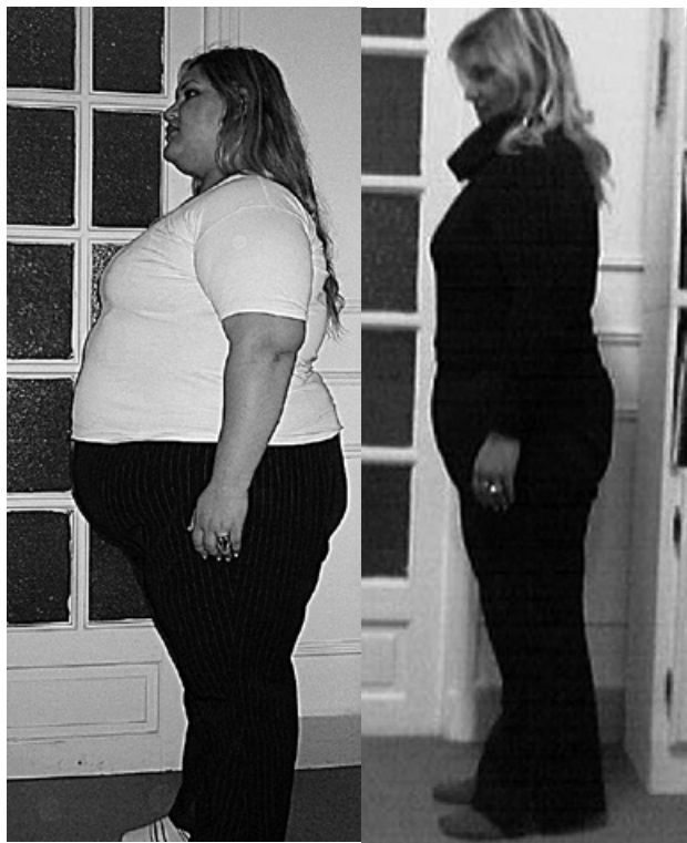
Figure 5. Patiente âgée de 18 ans, pesant 152 kg avec un indice de masse corporel de 52,6 au début du traitement.