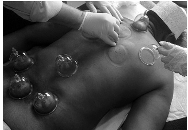
Figure 8. Ventouses (à dépression), cliché pris pendant la visite de Hamid Brahimi au Lotus Holistic Center.